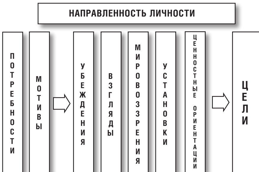
Рис. Структура направленности личности

Направленность личности Р.С. Немов определяет как систему доминирующих у человека потребностей, мотивов, целей, интересов, которые направляют его социальную активность. Направленность личности – это обусловленная системой побуждений личная целеустремленность человека. Содержание направленности (количество компонентов и их наименование) не вызывает больших разногласий, и такой компонент, как ценностные ориентации, в различных определениях присутствует всегда. Видимо, потому, полагает С.Л. Рубинштейн, что ценности более постоянны, чем цели, которые более гибки и способны варьироваться [2]. Структура направленности личности убедительно представлена В.Г. Крысько (см. рис.).