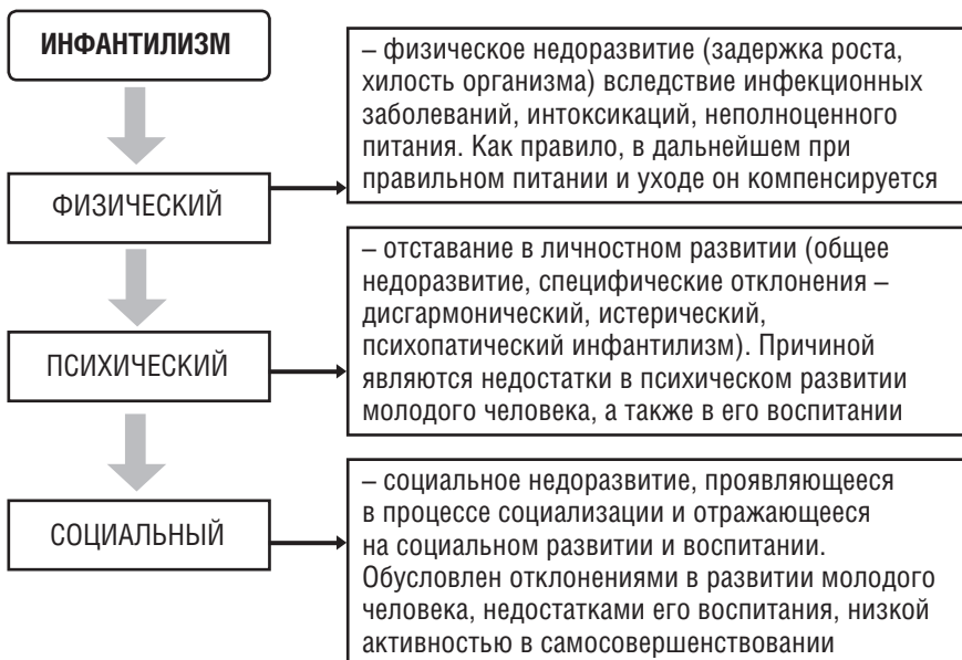
Рис. 3. Виды инфантилизма

тивалась. Видовые особенности инфантилизма автор выделяет, исходя из практики социальной и социально-педагогической работы. В поле деятельности специалистов социальной работы попадают следующие виды инфантилизма: физический, психический и социальный (рис. 3).