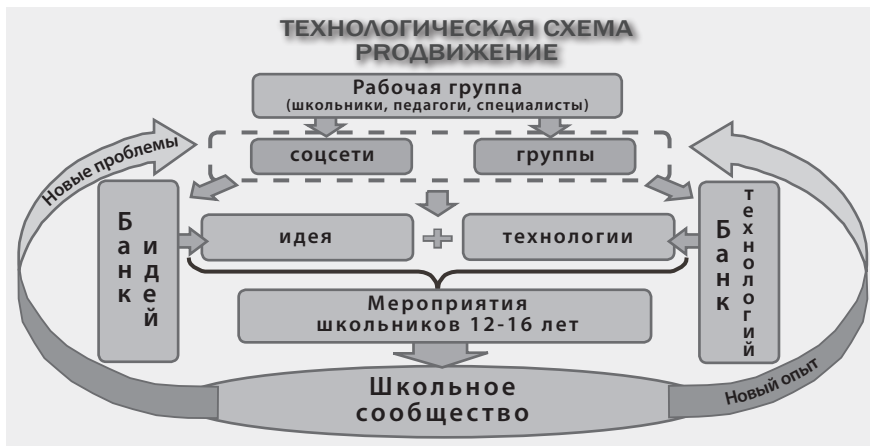
Рис. Технологическая схема Продвижение

Предлагаемая модель может быть применена в общеобразовательных учреждениях разных видов (см. рис.).