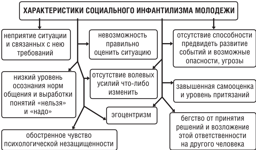
Рис. 2. Социальный инфантилизм молодежи

выполнять социокультурные функции (считающиеся функциями взрослых), совершить качественный переход и приобщиться к трудовой и общественно-политической деятельности, обзавестись семьей и т. д.